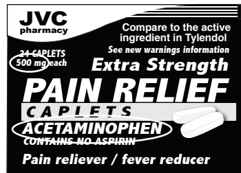
Generic name medicine label for acetaminophen