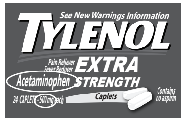
Brand name medicine label for acetaminophen

Compare las etiquetas de los medicamentos para asegurarse de que el medicamento de marca y el genérico tienen los mismos ingredientes activos . Los ingredientes activos son los medicamentos del producto que actúan para tratar su problema. Por ejemplo, el ingrediente activo, acetaminofén, aparece tanto en la etiqueta del medicamento de marca como en la del genérico a continuación.